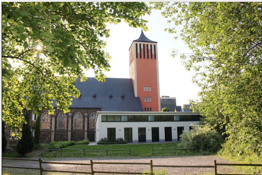
Kirche und Pfarrheim Herz Jesu Eilpe

Wir danken für Ihr Verständnis und wünschen allen viel Gesundheit und weiterhin Zuversicht!